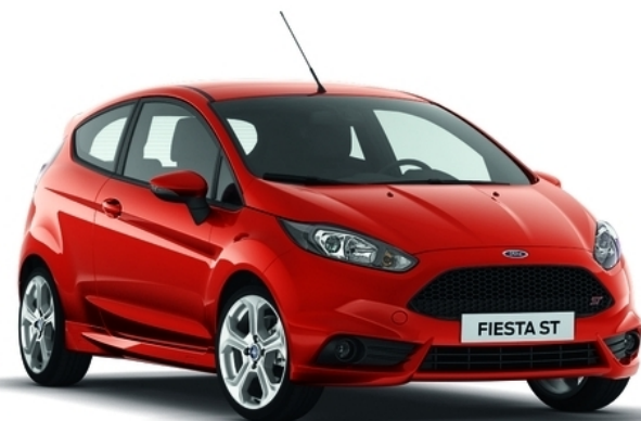
Abbildung zeigt Sonderausstattung.

Erstzulassung: 28.01.2016 Kilometerstand: 10 km Leistung: 182 PS Hubraum: 1.596 ccm Getriebeart: Getriebe 6-Gang - Typ: B6 Vorbisitzer: 1 Kraftstoff: Superbenzin Kraftstoffverbrauch kombiniert: 5,9 l CO2 Emmision: 140 g Fahrzeugfarbe: Pantherschwarz-Met.